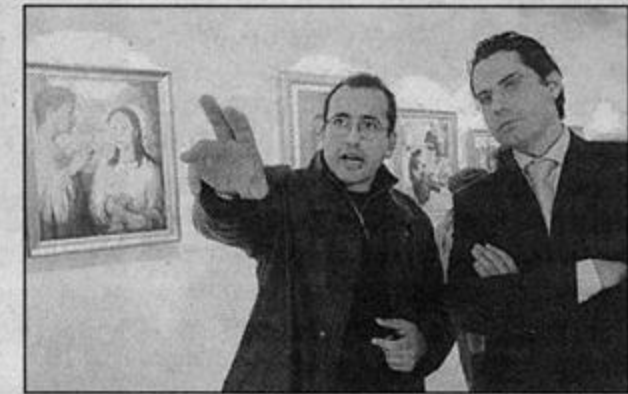
Un aspecto de la exposición